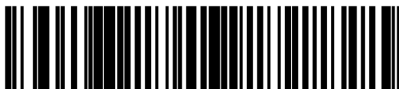
I 2 of 5 - Any Length