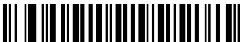
SINGLE LINE ONLY

Nu moet u synchroniseren met de cradel, dus scan de barcode welke op de cradel staat.